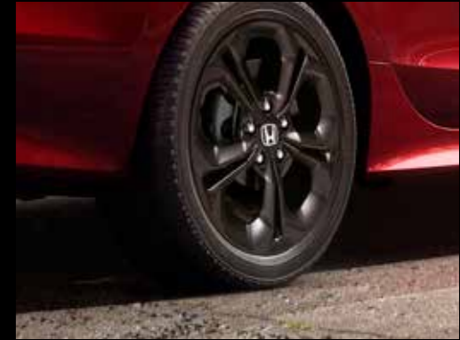
17" Alloy Gloss Black Wheels: The stylish 17" Alloy Wheels in the All- New Honda Civic gives it a bold and a stylish attitude.

Sporty Design: The All-New Civic boasts of various sporty elements such as Gloss Black Wheels, Black Shark Fin Antenna, Black Trunk Spoiler, Black Door Handles and Black Door Mirror.