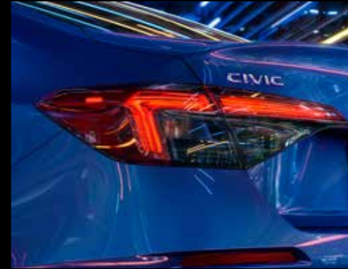
Tail lights: Using the latest LED technology, the brand-new design of the LED Tail lights give a dramatic effect.