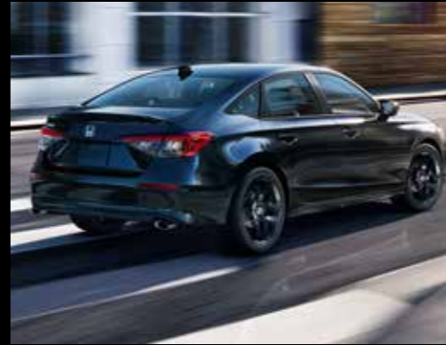
Twin Exhaust: A Chrome exhaust finisher gives the All New Civic a stylish performance inspired finish.