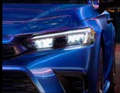
LED Headlights: The All-New Honda Civic has a full array of wide set LED headlights with Day Time Running Lights as standard.

عجلات من الألمنيوم الأسود المصقول 17 بوصة: سبيكة من الألمنيوم المصقول المطلية باللون الأسود مفاي 17 بوصة تمنح سيارة هوندا سيفيك الجديدة كُلياً مظهرًا جريئًا وطابعًا مميزًا.