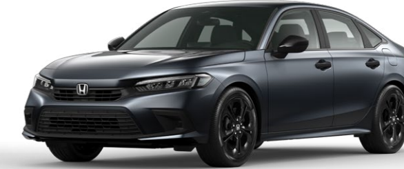
Meteoroid Gray Metallic