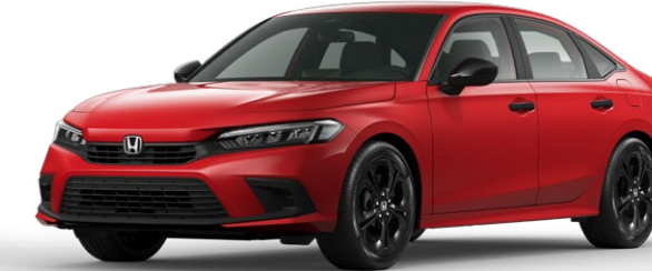
Coffee Cherry Red Metallic