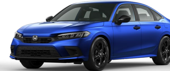
Brilliant Sporty Blue Metallic