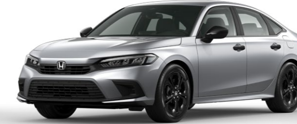
Lunar Silver Metallic